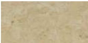
Színkód 317 - Márvány, fényes felületű, profilos