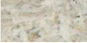
Színkód 344 - Gránit, fényes felületű, profilos