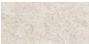
Színkód M391 - Márvány, matt felületű, profilos