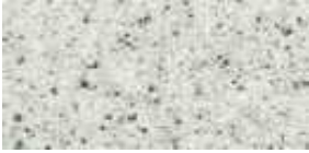
Színkód M330 - Gránit, matt felületű, profilos