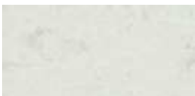
Színkód 318 - Márvány, fényes felületű, profilos