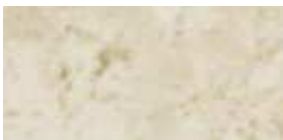
Színkód 391 - Márvány, fényes felületű,