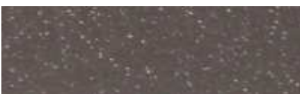
Színkód M234 - homok, matt felületű