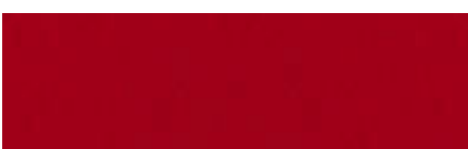
Színkód M260 - gránát, matt felületű