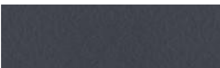
Színkód M250 - grafit, matt felületű